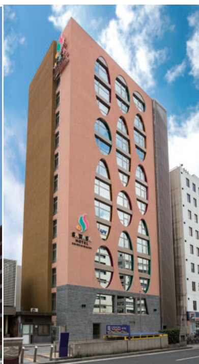
心齋橋 直近、地下鉄「長堀橋」駅徒歩1分 SARASA HOTEL 心齋橋 地上13階 総客室数107室