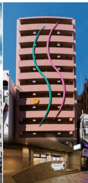
大阪らしさを満喫するなんば・日本橋の好立地 SARASA HOTEL なんば 地上12階 総客室数143室