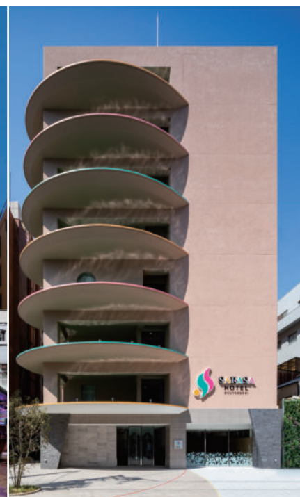
大阪メトロ「日本橋」駅徒歩6分 SARASA HOTEL 道頓堀 地上8階 総客室数164室