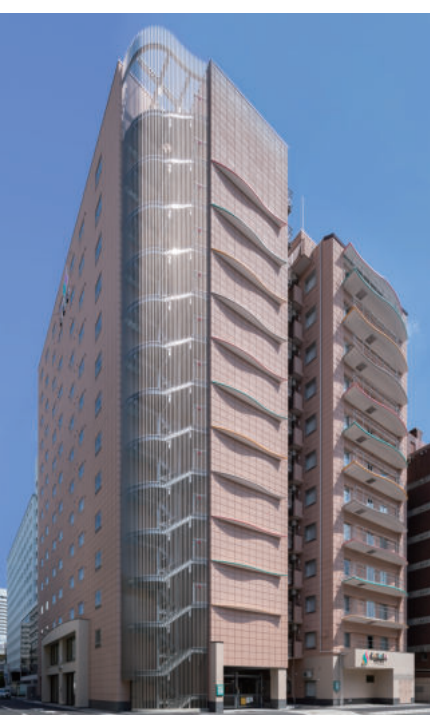
大阪メトロ・JR「新大阪」駅徒歩3分 SARASA HOTEL 新大阪 地上14階/13階 総客室数253室